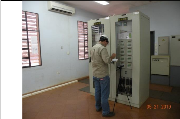
Subestación K15 – Sala de control