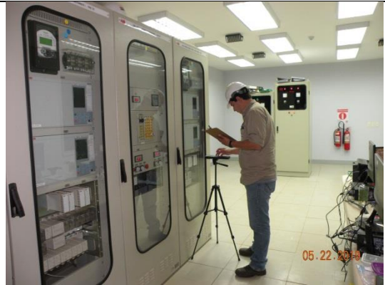
Subestación Microcentro – Sala de 23kV