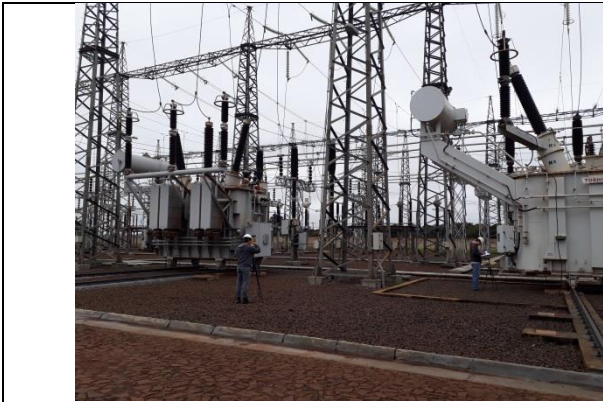
Subestación Presidente Franco – Patio de maniobras – Zona de transformadores de potencia