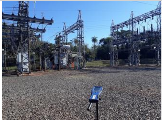
Subestación Paraguarí – Patio de maniobras